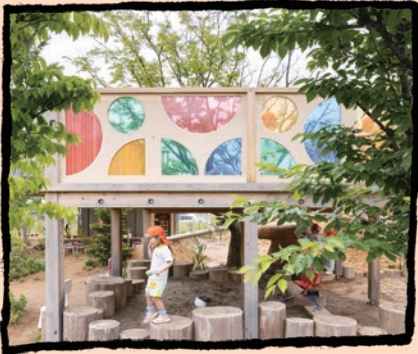
自然豊かで多彩な遊びができる園庭