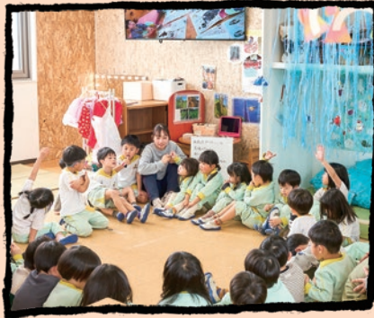
対話が生まれる「共主体」の保育環境