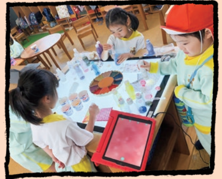
「子どもの道具」としてのICT